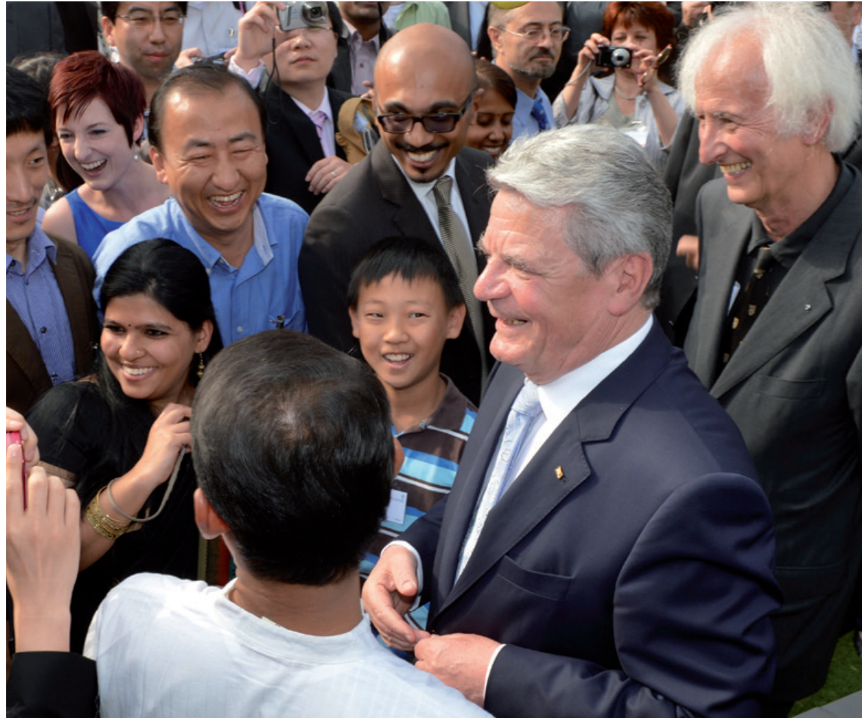
Jahrestagung der Alexander von Humboldt-Stiftung: Bundespräsident Joachim Gauck empfängt Humboldtianerinnen und Humboldtianer und ihre Familien am Schloss Bellevue.